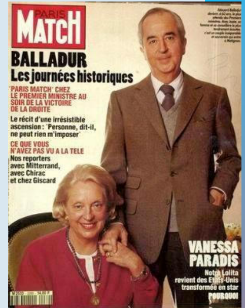
Doc.4 Une du magazine patriote Paris Match illustrant les vertus de la famille de français moyens.