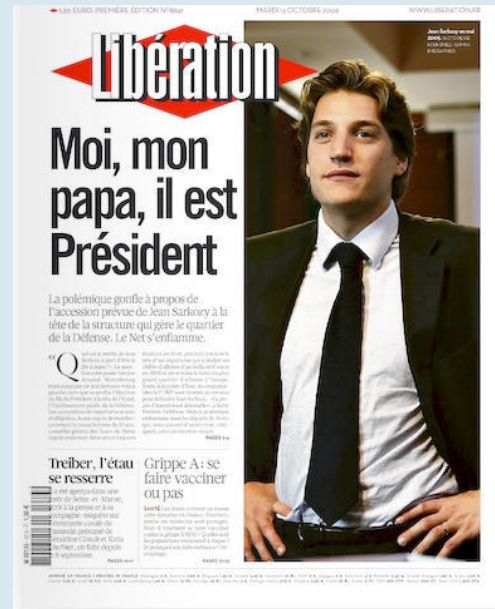
Doc.3 Une du journal socialo-trotskyste Libération, symbole de l'AntiFrance.